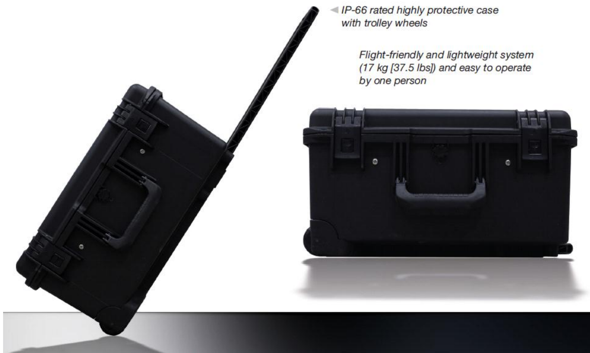
IP-66 rated highly protective case with trolley wheels Flight-friendly and lightweight system (17 kg [37.5 lbs]) and easy to operate by one person