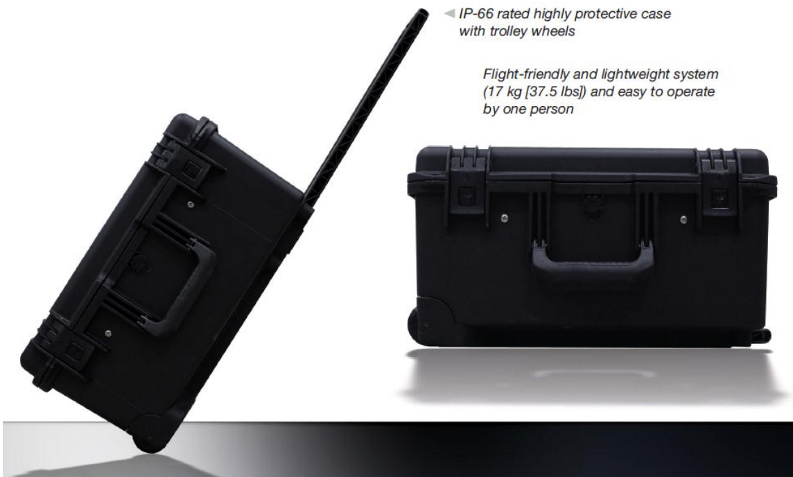
IP-66 rated highly protective case with trolley wheels Flight-friendly and lightweight system (17 kg [37.5 lbs]) and easy to operate by one person